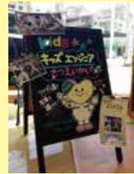
キッズエンジニア撮影会でぎゅわいませ!