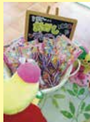
トヨピーからお子様へお菓子もプレゼント♡