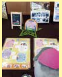
トヨピーカレンダーも大人気です!