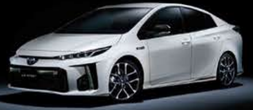
Photo:"350RDS"GR SPORT。 ボディカラーのホワイトパールクリスタルシャインは メーカーオプション。専用19インチアルミホイール (ダークスリットリング・レッドライン仕様)は GR SPORT 専用メーカーオプション。 GRボディスタイルは販売店装着オプション。

Photo:"GR SPORT"。 ボディカラーのホワイトパールクリスタルシャインはメーカーオプション。 GRボディスタイルは販売店装着オプション。