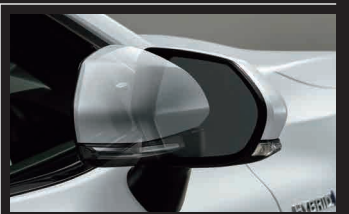
■ オートリトラクタブルミラー