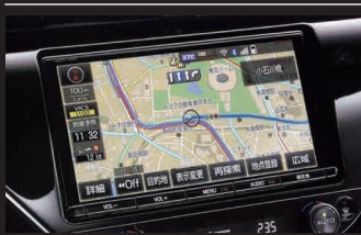
■ 9インチT-Connect SDナビゲーション NSZT-Y66T