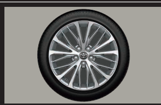
■ 235/45R18タイヤ GOODYEAR &18×8Jアルミホイール