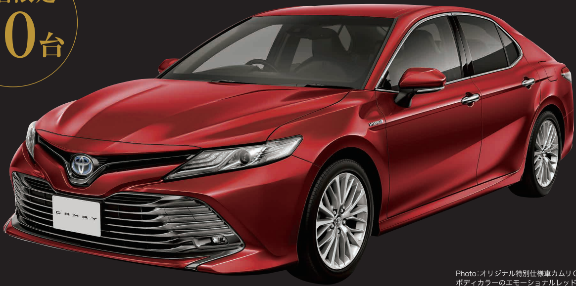
Photo:オリジナル特別仕様車カムリG "PREMIUM"。 ボディカラーのエモーショナルレッド(54,000円)は メーカーオプションで価格に含まれておりません。